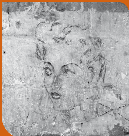
Graffiti dans la casemate n° 17 du fort de Romainville représentant un visage.