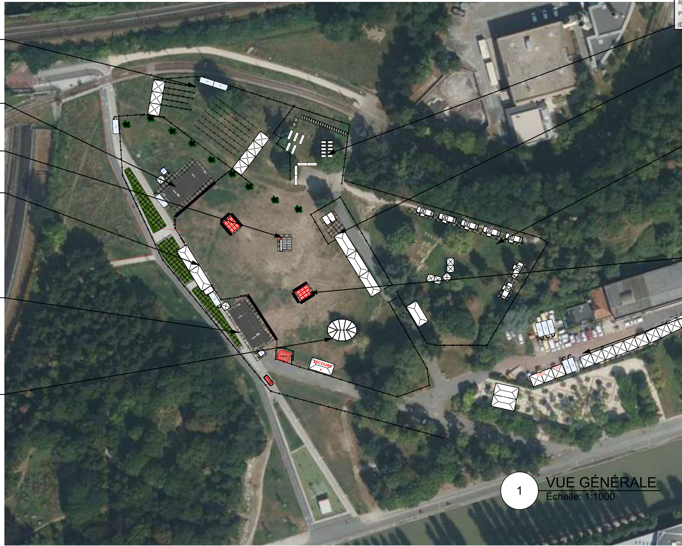
1 VUE GÉNÉRALE Échelle: 1:1000

BAR (30M LINÉAIRE) ZONE FOOD & CHILL RÉGIE ESPACE PRODUCTION & ARTISTES