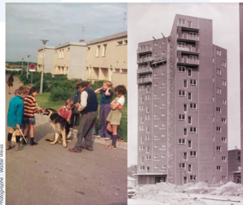
Des enfants et un homme avec un chien dans les rues de l'ensemble de logements de la Cité de Promotion Familiale d'Alie à toute adresse (APD).

Date : À partir du vendredi 30 juin et pendant tout l'été Lieu : Parc de la Bergère, Bobigny Modalité : Gratuit, en accès libre